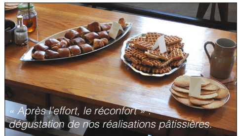
« Après l’effort, le réconfort » : dégustation de nos réalisations pâtisseries.