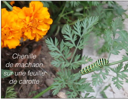
Chenille de machaon sur une feuille de carotte