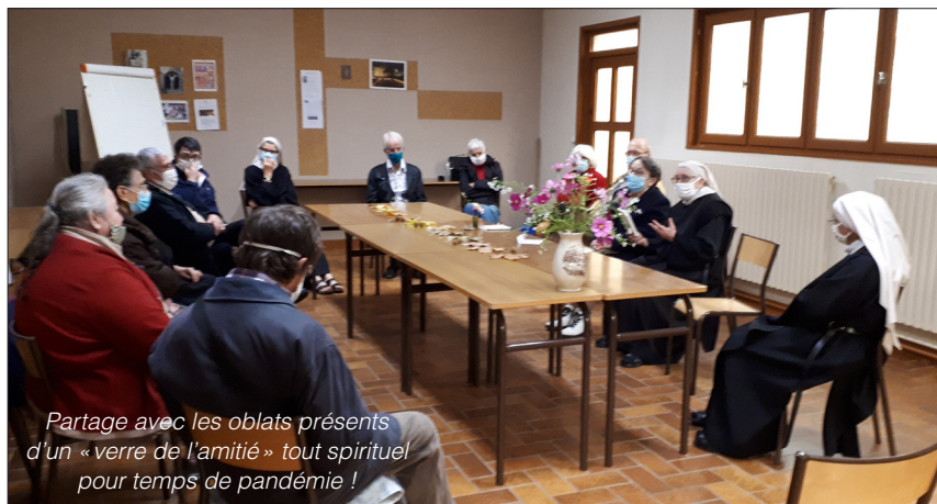
Partage avec les oblats présents d'un « verre de l'amitié » tout spirituel pour temps de pandémie !