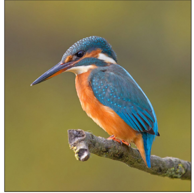
Martin-pêcheur tel qu'il se laisse rarement observer : ordinairement, nous ne voyons qu'un éclair saphir raser l'eau !