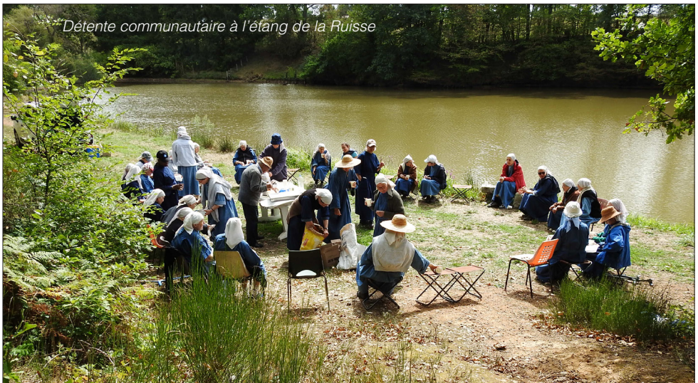
Détente communautaire à l’étang de la Ruisse